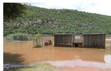
Kranspoortlake after heavy rainfall in December 2020