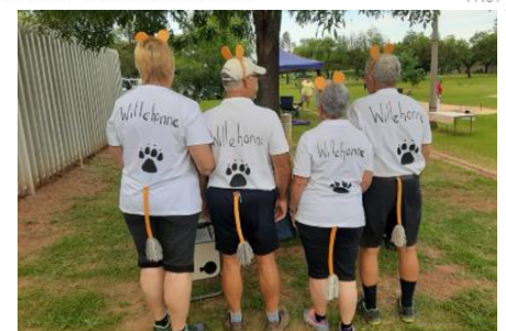
12 Des - De Klerkdag te Middelburg. Willehonne