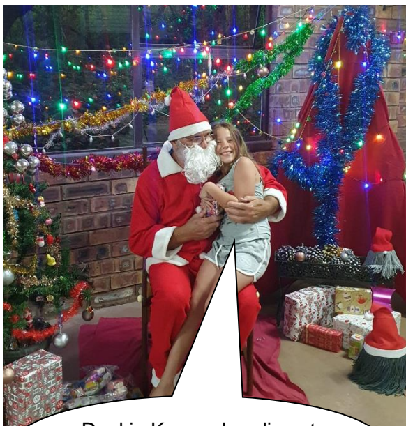
Dankie Kersvader, dis net wat ek graag wou hê.