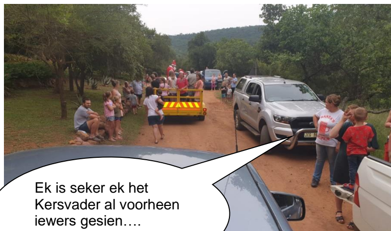
Ek is seker ek het Kersvader al voorheen iewers gesien....