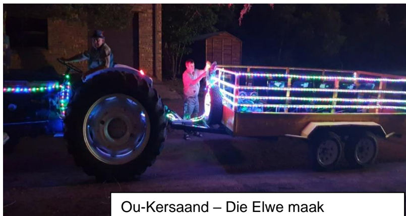
Ou-Kersaand – Die Elwe maak Kersvader se Boereslee gereed.