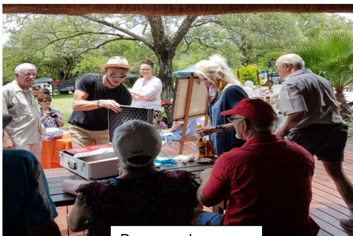
Pryse word gewen