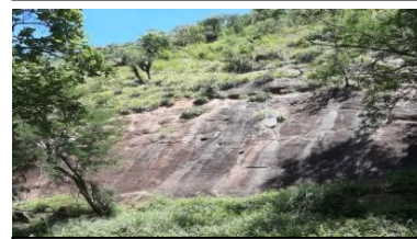
Hikingtrail in Kranspoort.