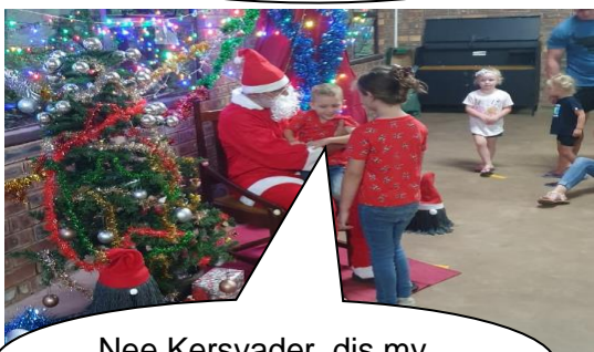
Nee Kersvader, dis my sussie... nie 'n Elf nie...